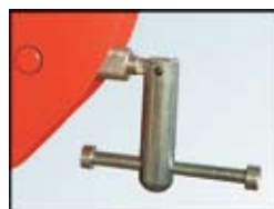
B TIP: sklopljiva ručka