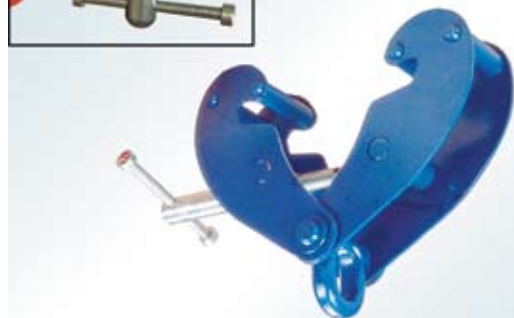
Q TIP sa ringom