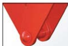
A TIP standardna